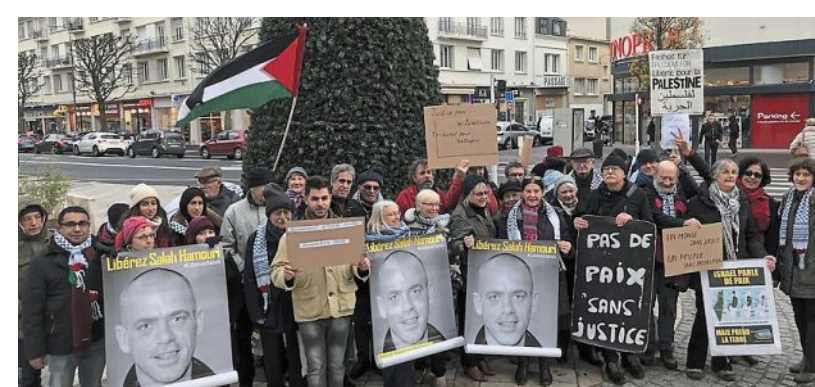
Une trentaine de militants et sympathisants se sont mobilisés pour réclamer la paix en Palestine, à l'appel de Femmes en noir et de l'AFPS.