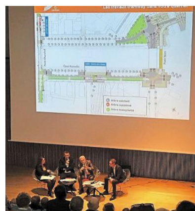
L'équipe municipale a détaillé le calendrier des travaux du tramway aux habitants du sud du centre-ville, à la bibliothèque.

Jeudi soir, la municipalité a présenté, aux riverains des quartiers Presqu'île et Résistance, le nouveau plan de circulation pendant les travaux du tramway. Et les inconvénients qui en découlent.